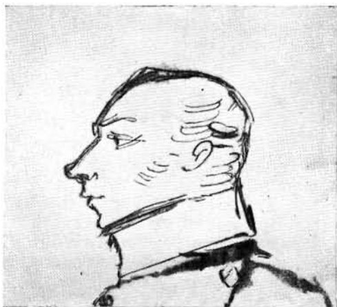
М. Ф. ОРЛОВ

Теперь мы можем судить из одного, к чему ведет доброе обхождение с подчиненными 8 . Едва начали управлять частями, нам вверенными, с отеческою попечительностью, как большая часть побегов уже прекратилась. Еще шаг, и наша дивизия, порицаемая сперва пред всеми прочими, послужит вскоре для них примером верности и устройства. Я прошу господ полковых командиров и всех частных начальников вспомнить, что солдаты такие же люди, как и мы, что они могут чувствовать и думать, иметь добродетели, им свойственные, и что можно их подвигнуть ко всему великому и славному без палок и побоев 9 . Пускай виновные будут преданы справедливому взысканию закона, но те, кои воздерживаются от пороков,