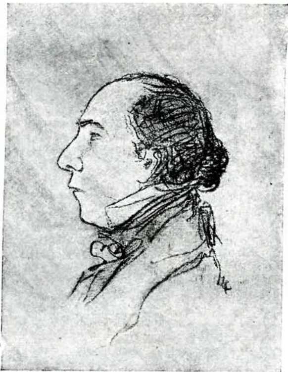
Т. Н. ГРАНОВСКИЙ