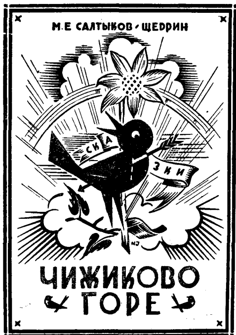
ОБЛОЖКА РАБОТЫ Н. В. ИЛЬИНА К ИЗДАНИЮ СКАЗКИ ЩЕДРИНА «ЧИЖИКОВО ГОРЕ», 1928 г.

Параллельно в том же издательстве выходит второе издание «Истории одного города» научно-академического типа. Вступительные статьи, комментарии, критика текста Я. Эльсберга и С. Макашина.