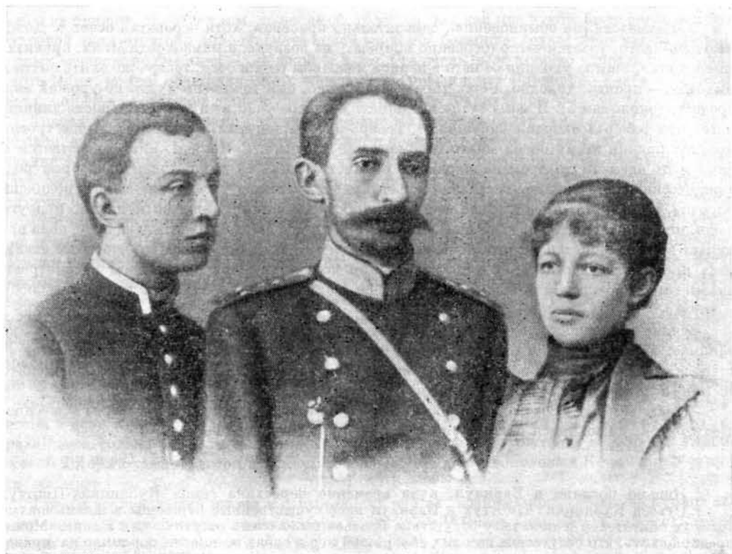
БЛОК С МАТЕРЬЮ И ОТЧИМОМ