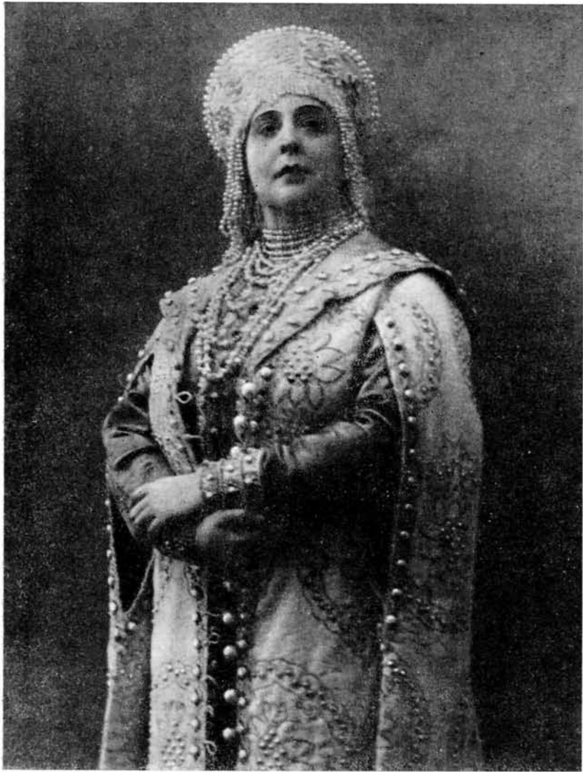
А. А. ЯБЛОЧКИНА В РОЛИ ВАСИЛИСЫ («ВАСИЛИСА МЕЛЕНТЬЕВА»)