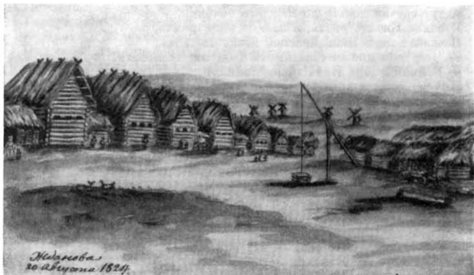
ДЕРЕВНЯ ЖДАНОВО НИЖЕГОРОДСКОЙ ГУБЕРНИИ Рисунок (сепия) из альбома неизвестного художника, 1824

Ходил козел на базар, Колёда! Купил козел косу, Колёда! — На что ему косу? Колёда!