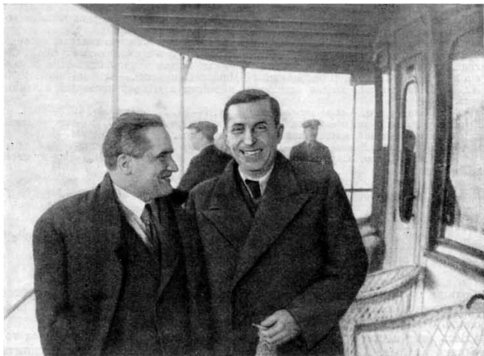
М. М. ЗОЩЕНКО и Ю. К. ОЛЕША

Вместе с этим письмом послал почтительное прошение Жакту 1 и так убедительно написал ему, что — уверен: он, Жакт, прошение мое удовлетворит и комнату за техником оставит.