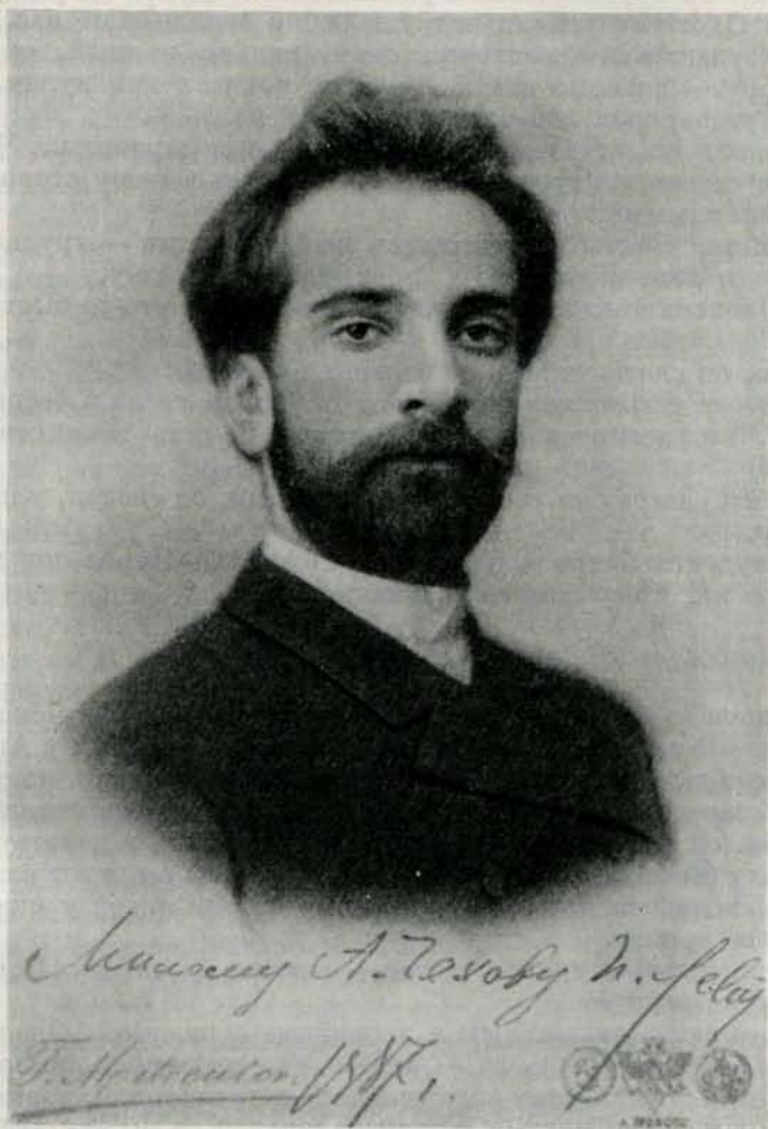
И. И. ЛЕВИТАН

— Что это там летит?...— крикнул один из них, обращаясь к Левитану.