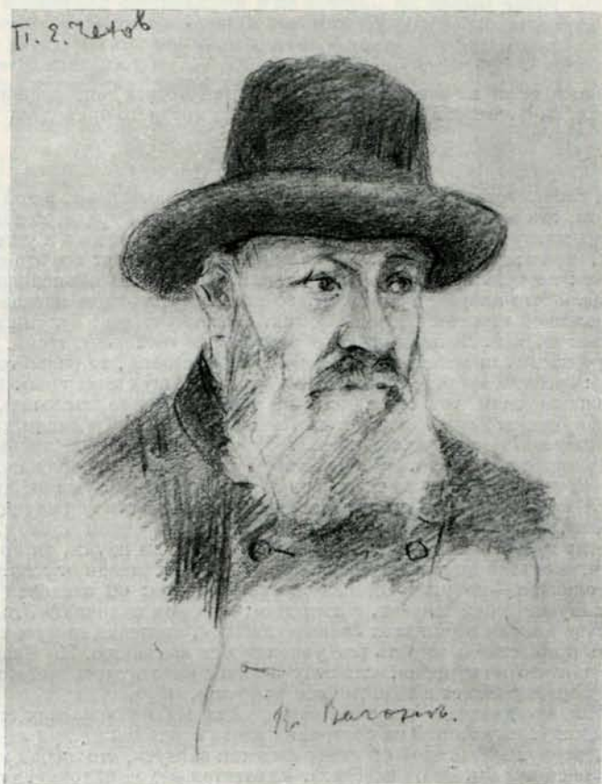
П. Е. ЧЕХОВ

происшествия и застала Александра ревушим во все лопатки и держащим что-то во рту, за левой щекой. Около него суетилась прислуга, всхлипывала, хлопая ладонями тетка, и даже бабушка перестала улыбаться. Мать посмотрела пристально на Александра, топнула ногой и закричала: