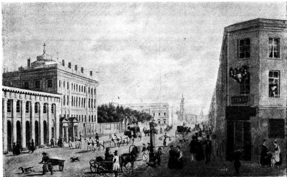
УГОЛ НЕВСКОГО И НАБЕРЕЖНОЙ ФОНТАНКИ В ПЕТЕРБУРГЕ

Вернемся теперь к тем строфам «Торжества победителей», которые были применены Белинским непосредственно к Пушкину. Белинский выбрал