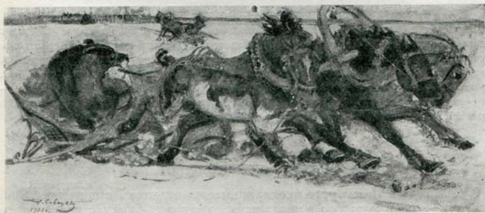
ИЛЛЮСТРАЦИЯ К СТИХОТВОРЕНИЮ «ГЕНЕРАЛ ТОПТЫГИН»

Приобретая это новое положение своему журналу, редакция «Современника» останется с тем вместе верна принципу, которого она твердо держалась. Гордясь участием писателей, уже заслуживших сочувствие публики, она употребляет все свои усилия на то, чтобы сделать свой журнал посредником между публикою и вновь являющимися талантами. Она готова признать, что успехи литературы зависят как от развития деятельности писателей, уже пользующихся заслуженною известностью, так и