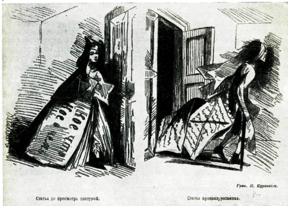
Статья по вопросу цензуры.

Если, таким образом, весной 1856 г. Некрасов не согласился на замену Чернышевского Григорьевым, то летом, того же года он дал новое еще более яркое доказательство того, насколько он ценит Чернышевского и доверяет ему: уезжая за границу, он передал ему свои редакторские права. Этот факт представляется тем более симптоматичным, что он был официально зафиксирован тотчас после того, как Толстой предпринял свою известную атаку против Чернышевского. Его письмо к Некрасову от 2 июля 1856 г., где он с та-